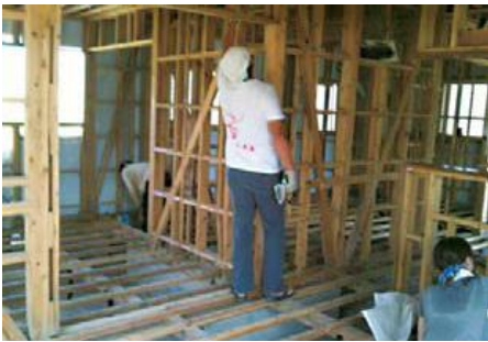
災區的房屋受害甚大，不只木匠不足連建材也不足。 須要專業者修理的地方由臺灣來的木工技師們修理。