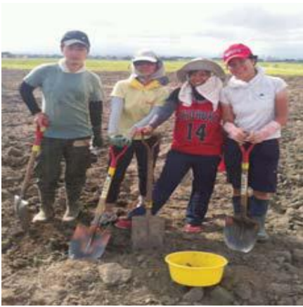
用鏟子將土放入篩子，以濾過小瓦礫。