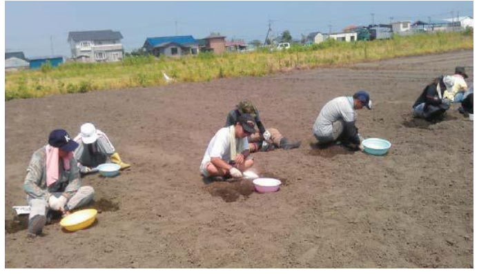
大型的瓦礫雖已撿拾乾淨，但田裡仍留有很多玻璃片、木片、陶器破片等，以致田地未能耕種，大家孜孜不倦的撿拾這些小瓦礫。