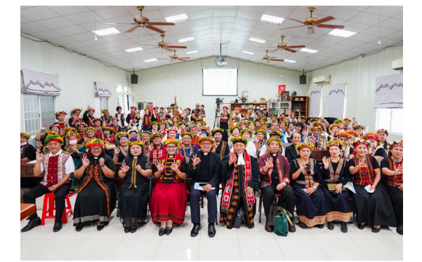
▲ 30週年感恩禮拜大合照。