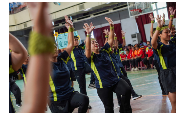
▲ 參加中會舉辦的健康操觀摩賽。