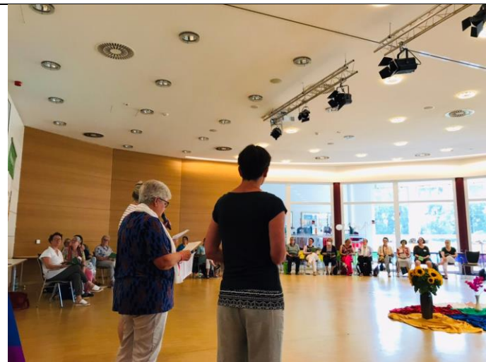
介紹代禱國家-台灣