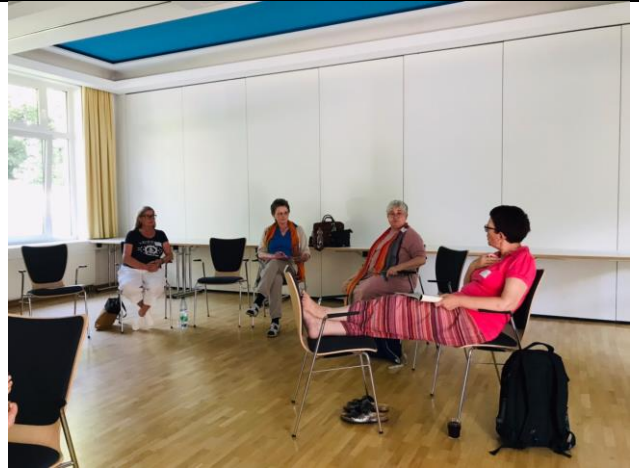
女性角色與性別平等