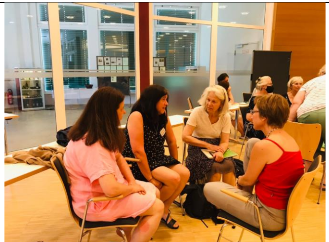
小組討論、分享聖靈在彼此身上做的工