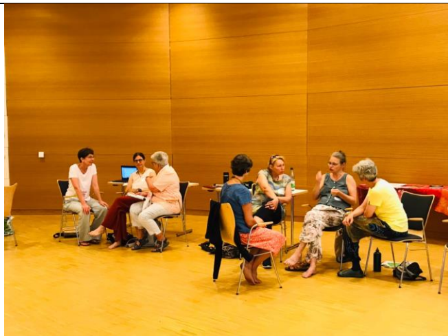
小組討論、分享彼此的信仰經歷