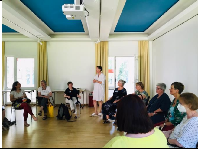
殖民主義對台灣現今的影響與挑戰