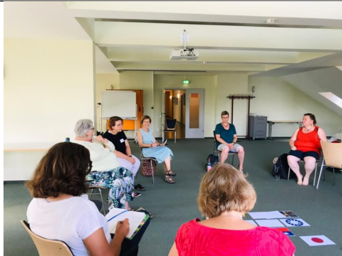
近 20 年間台灣家庭面臨的試煉與磨難