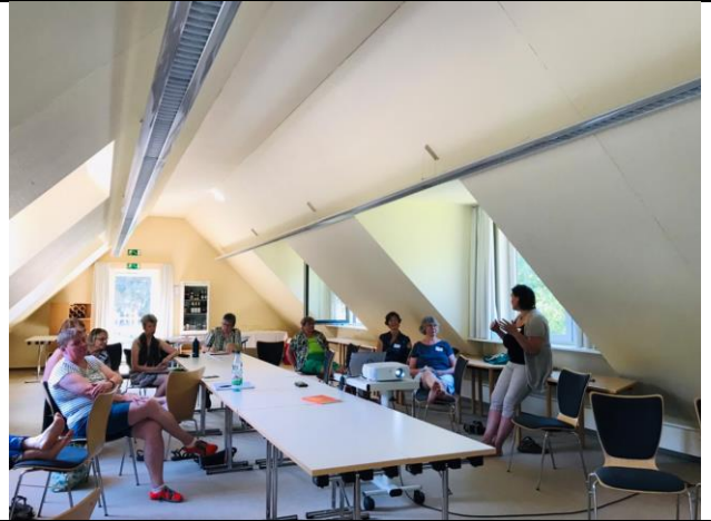
探討台灣人的民族精神-韌性