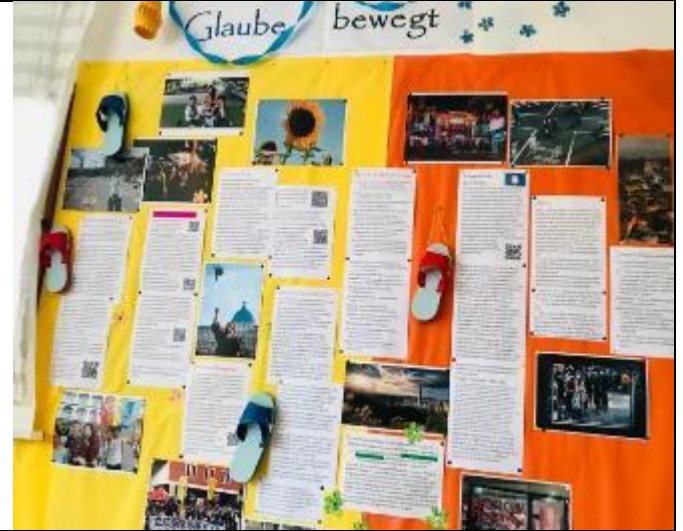
台灣現今社會議題專欄