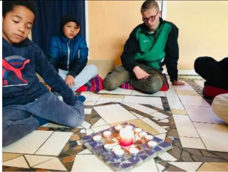
小朋友點蠟燭禱告