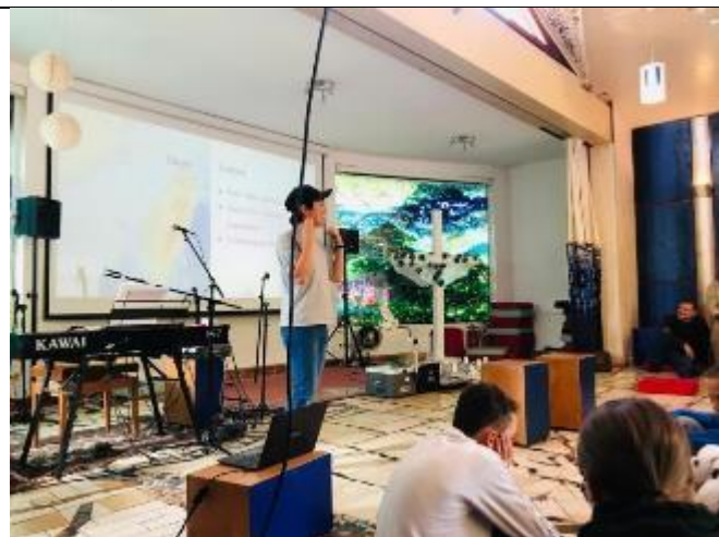
大使館時間介紹台灣