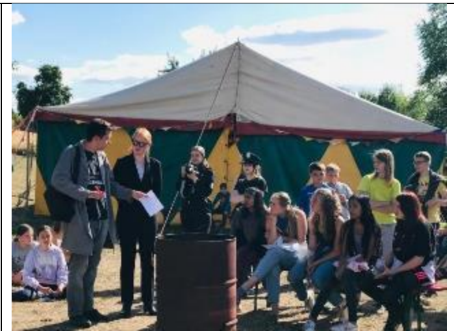
角色扮演遊戲-警察抓兇手