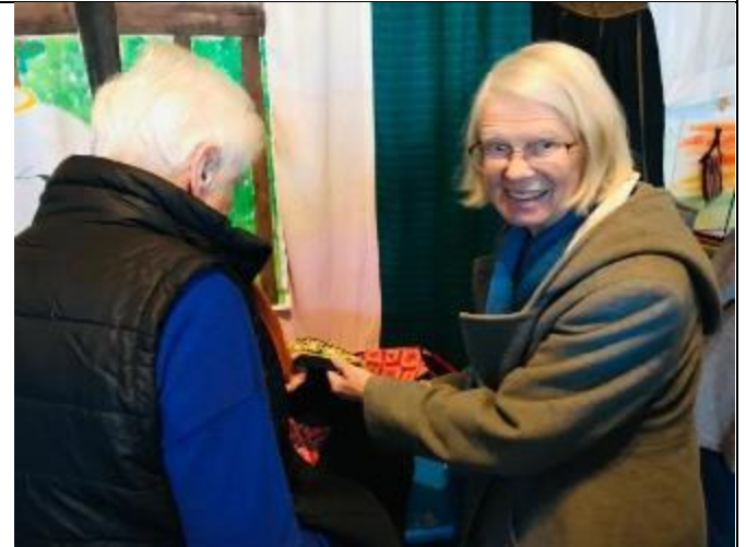
婦女欣賞原住民織布