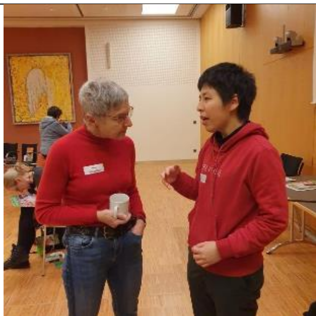
德國婦女請教我關於台灣的文化