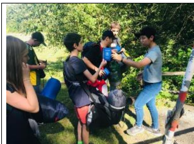
德國小朋友「入境」國際領土