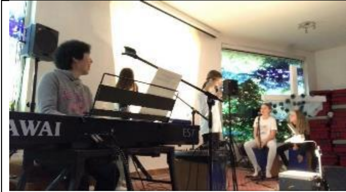
跟小朋友一起組樂團