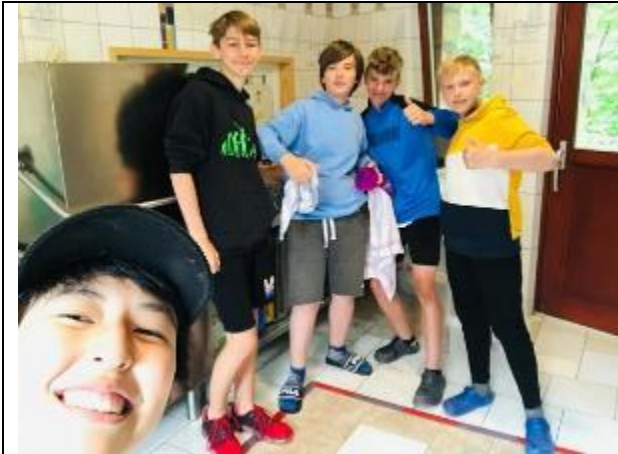
與小朋友一起洗碗

目的是要建立他們對這座山的歸屬感。在營會裡沒有所謂顧客至上，而是人人平等，志工會帶著團員一起整理環境，例如洗碗、擦桌子、打掃廁所...，因著他們對這座山的歸屬感，他們樂意做這些打掃工作，通常第一天會手忙腳亂甚至遇到聽不懂英文的團員，我盡量用德語和他們溝通，多給他們耐心和鼓勵，他們就可以把工作做得越來越好。帶領他們的過程中不只是他們有成長，我的領導和溝通能力提升許多，也讓我的德語能力也更上一層樓。感謝他們教我更道地的德文，甚至收到許多德國人對我德語能力的肯定。