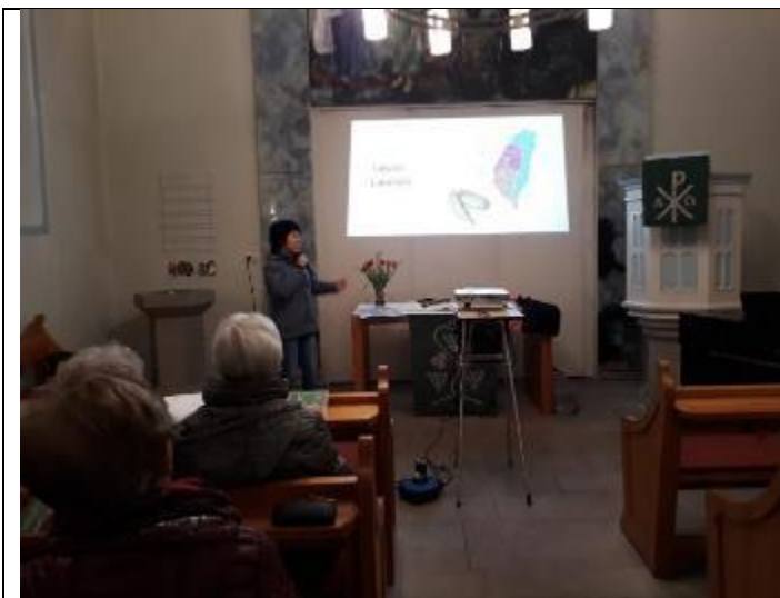
向德國婦女介紹台灣