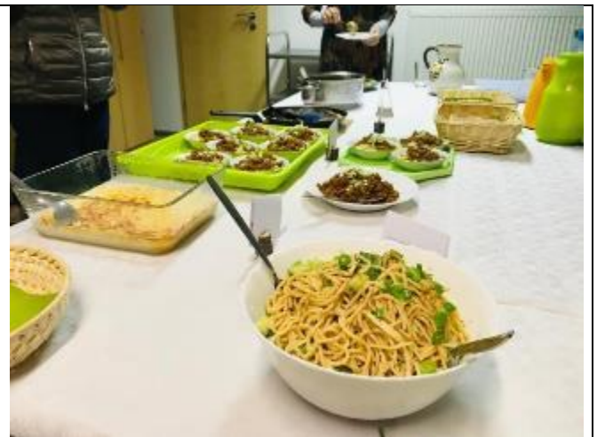
德國婦女嘗試製作麻醬麵和肉燥