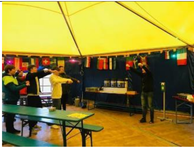
小朋友飯前唱謝飯歌