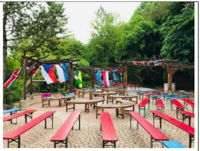
場地佈置-各國國旗

每當我停下腳步仰望營區山頂的十字架，我總是讚嘆上帝如此的奇妙。我從來都沒有想過，有人願意花 25 年的時間蓋一座山，兩位來自不同教派的牧者(新教派與五旬節宗)竟然可以經營一個基金會！我了解到教會合一的要素不是人與人彼此的共同點，而是我們敬拜同一位上帝，是這位上帝使我們接納與欣賞彼此的差異，並且站在祂立的根基上。祂不斷的在引領我們回到祂面前，幫助我們練習彼此相愛與服事，為的就是將來有一天當祂的國度降臨時，我們跨出我們現有的文化並且進入到祂的國度，讓台灣人不再是台灣人，德國人不再是德國人，我們都是屬神的人。