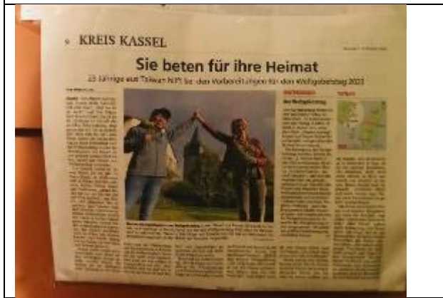
德國北黑森廣播電台專訪