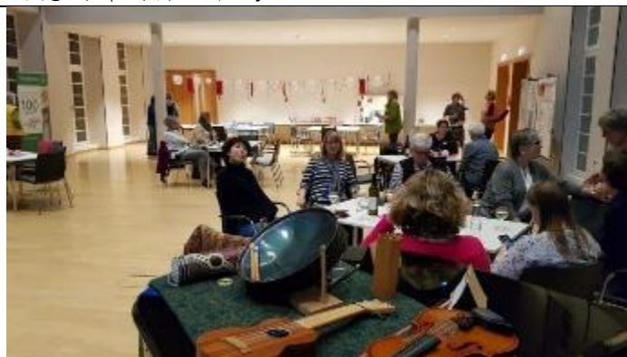
與德國婦女交流、聊天