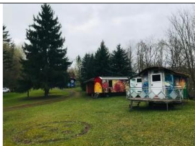
不同國家風格的大使館(露營車)