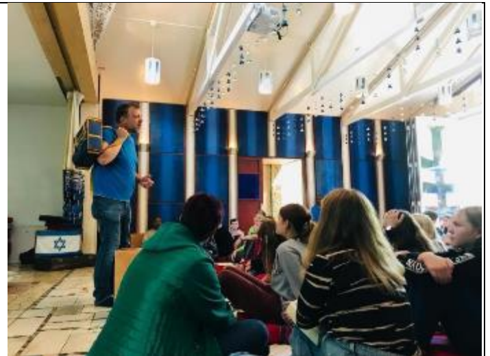
同工分享聖經故事