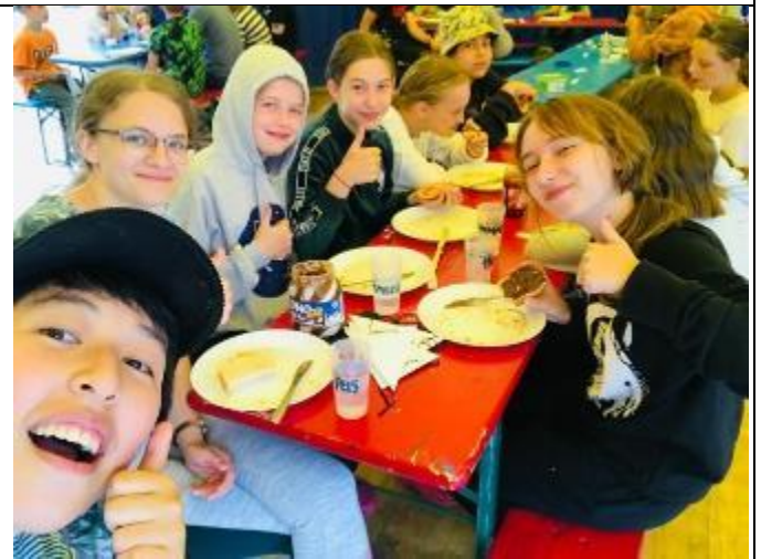
與小朋友一起吃早餐